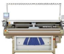
ホールガーメント横編機