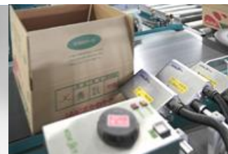
段ボール用プリンターあらゆる生産ラインに応じて対応